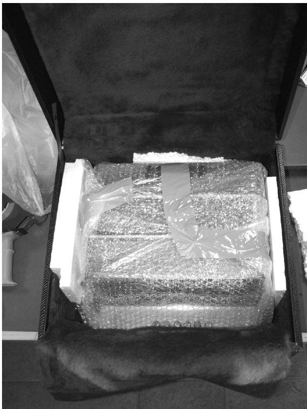
1 Calage des côtés

L'emballage maintenant : il faut que le diato soit calé dans sa boîte par du polystyrène ou autre (mais pas une mousse molle) pour qu'il ne puisse pas bouger. Il faut caler l'avant de l'accordéon sauf les boutons de basses avec un polystyrène de l'épaisseur des basses. Explication : quand la caisse prend un coup sur le côté avant de l'accordéon, tout le poids de l'accordéon s'applique sur ce côté de caisse (action-réaction), et si les basses dépassent, c'est cet endroit-là qui prend tout le poids : résultat, ça casse. Il faut répartir le poids de l'instrument sur la plus grande surface possible.